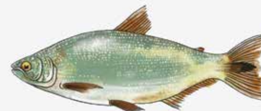
Salmón de río o Pirapitá ( Brycon orbignyanus )