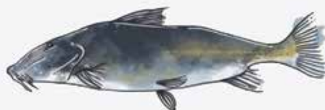
Armado chancho ( Oxydoras kneri )