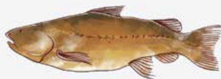
Armado común ( Pterodoras granulosus )